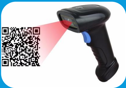
QR Code Reader

इस डिवाइस का उपयोग QR Code को स्कैन करने के लिए किया जाता है।